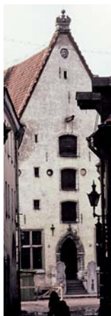
Tallinn, köpmanhus från 1400-talet

Efter middagen vidare till Saka Cliff hotell. (Totalt i buss denna dag ca 170km.)