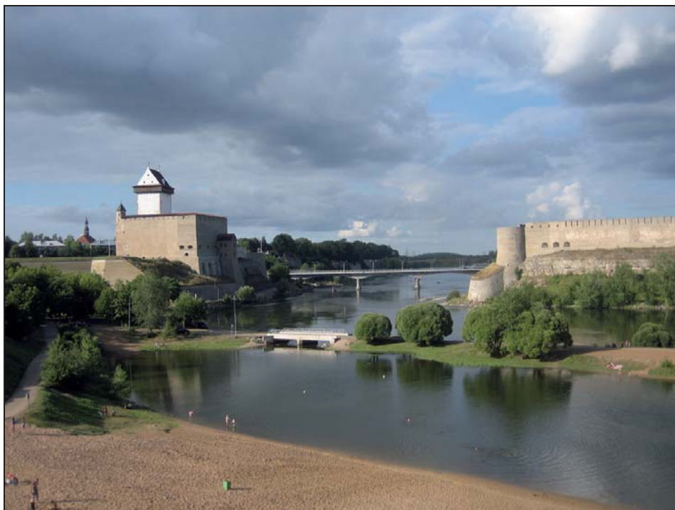
Borgarna på var sin sida Narvafloden – Hermansborg och Ivangorod